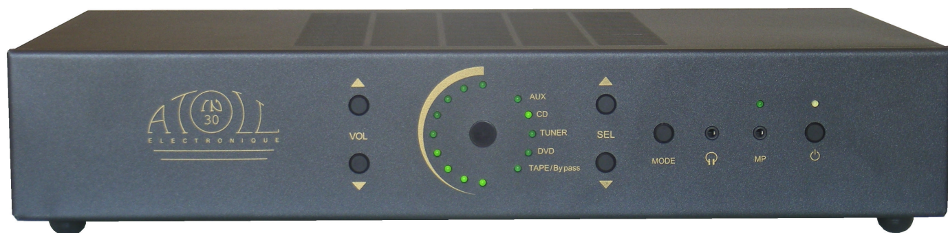
Schéma symétrique à composants discrets, transistors MOS-FET, transformateur torique de 170 VA, châssis en acier de 1,5 mm.

« Un amplificateur Intégré Haute Fidélité, conçu et fabriqué entièrement en France, pour moins de 400 euros : voici le dernier né d'ATOLL.